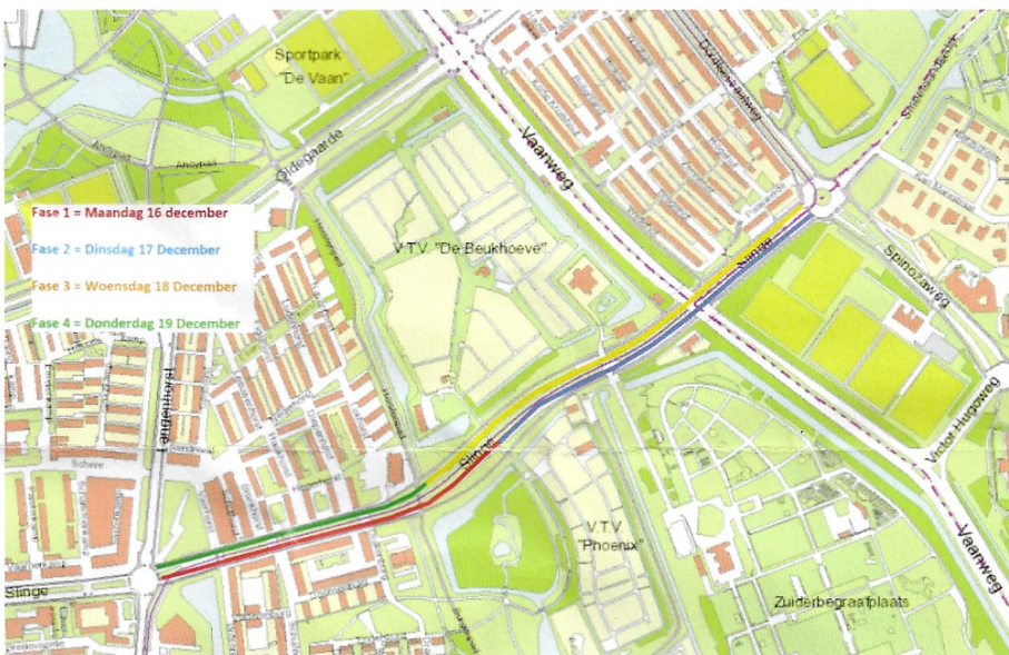
werkgebied en werkvolgorde

Voor meer informatie over bus 70 verwijzen we u naar RET. RET informeert over omleidingen en storingen, onder andere via hun www.ret.nl , app en social media kanalen.